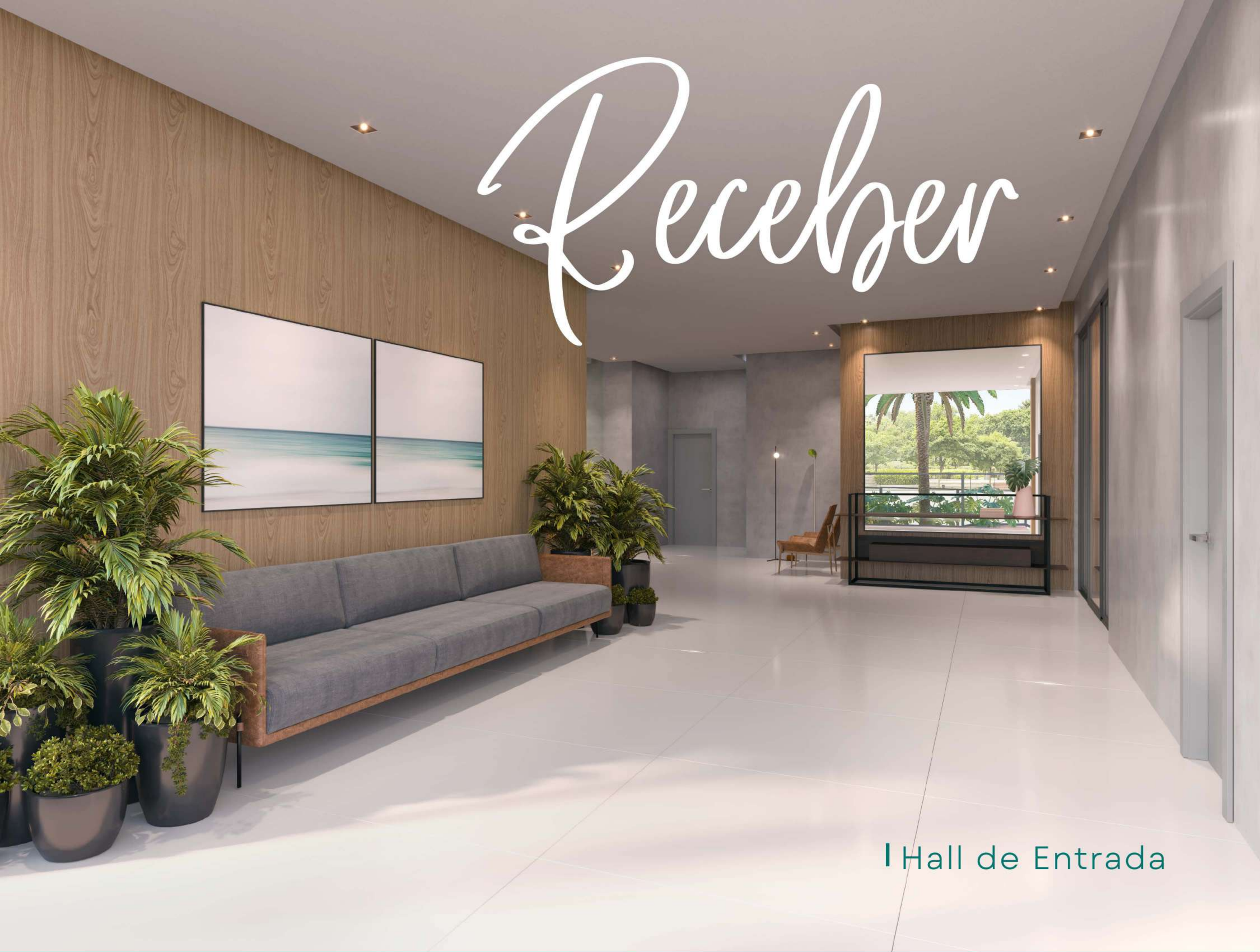
| Hall de Entrada