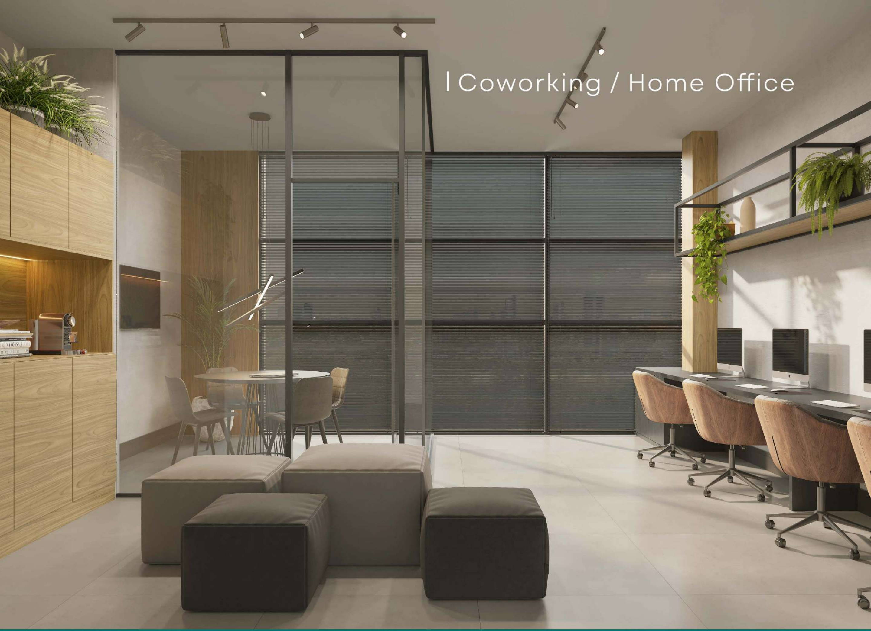
| Coworking / Home Office