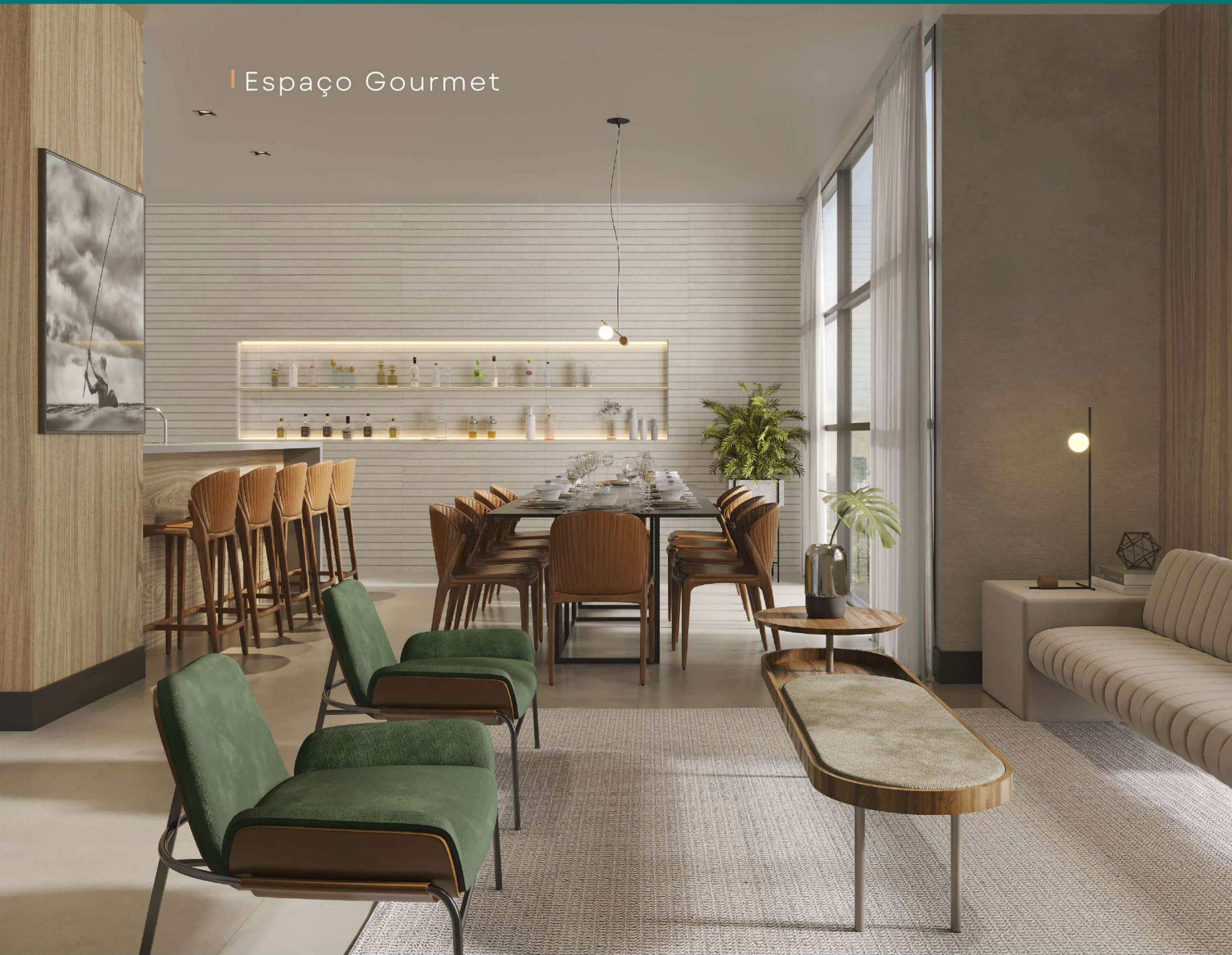
| Espaço Gourmet